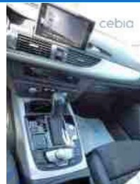
Pohled středový tunel s mech. zab.