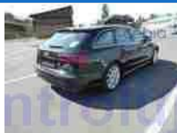
Pohled zád-pravý bok