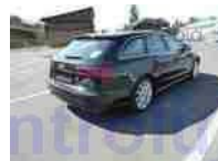
Pohled zád-pravý bok