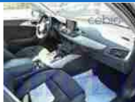
Pohled palubní deska