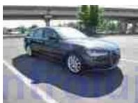
Pohled čelo-pravý bok