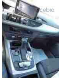
Pohled středový tunel s mech. zab.