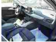
Pohled palubní deska