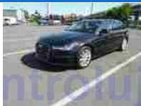
Pohled čelo-levý bok