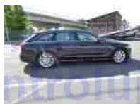
Pohled pravý bok