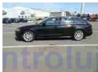
Pohled levý bok