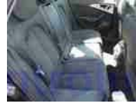
Celkový pohled do interiéru