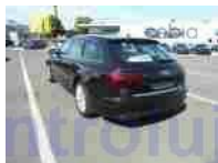
Pohled zád-levý bok