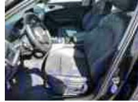
Pohled interiér, přední sedačky