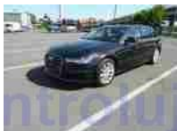
Pohled čelo-levý bok